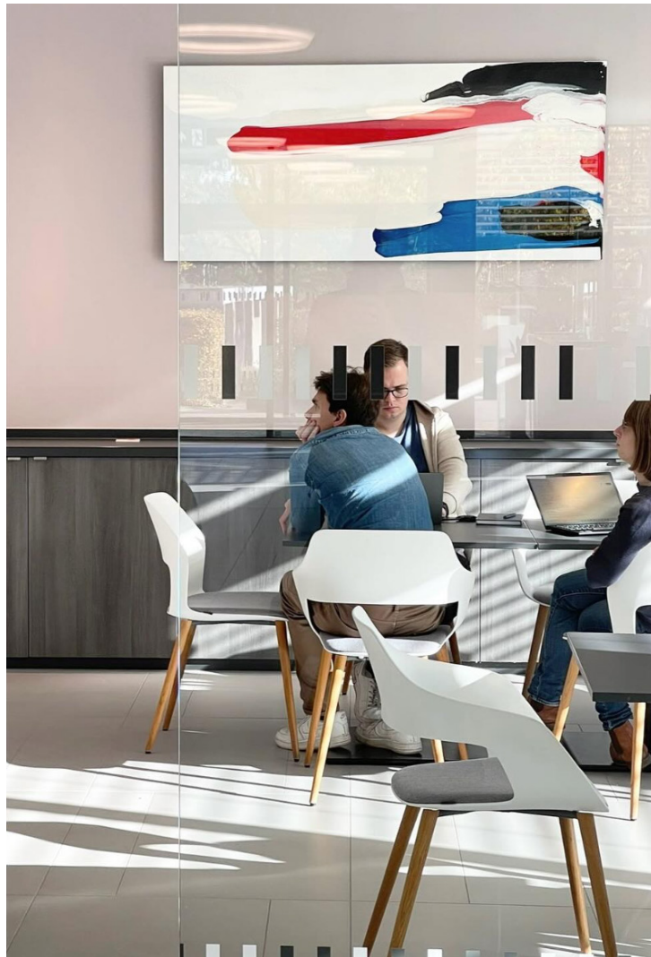
Referenz - Tauchgang 03 im Fraunhofer Institut, Hannover Acryllack auf Alu-Dibond, 2025 80cm x 180cm