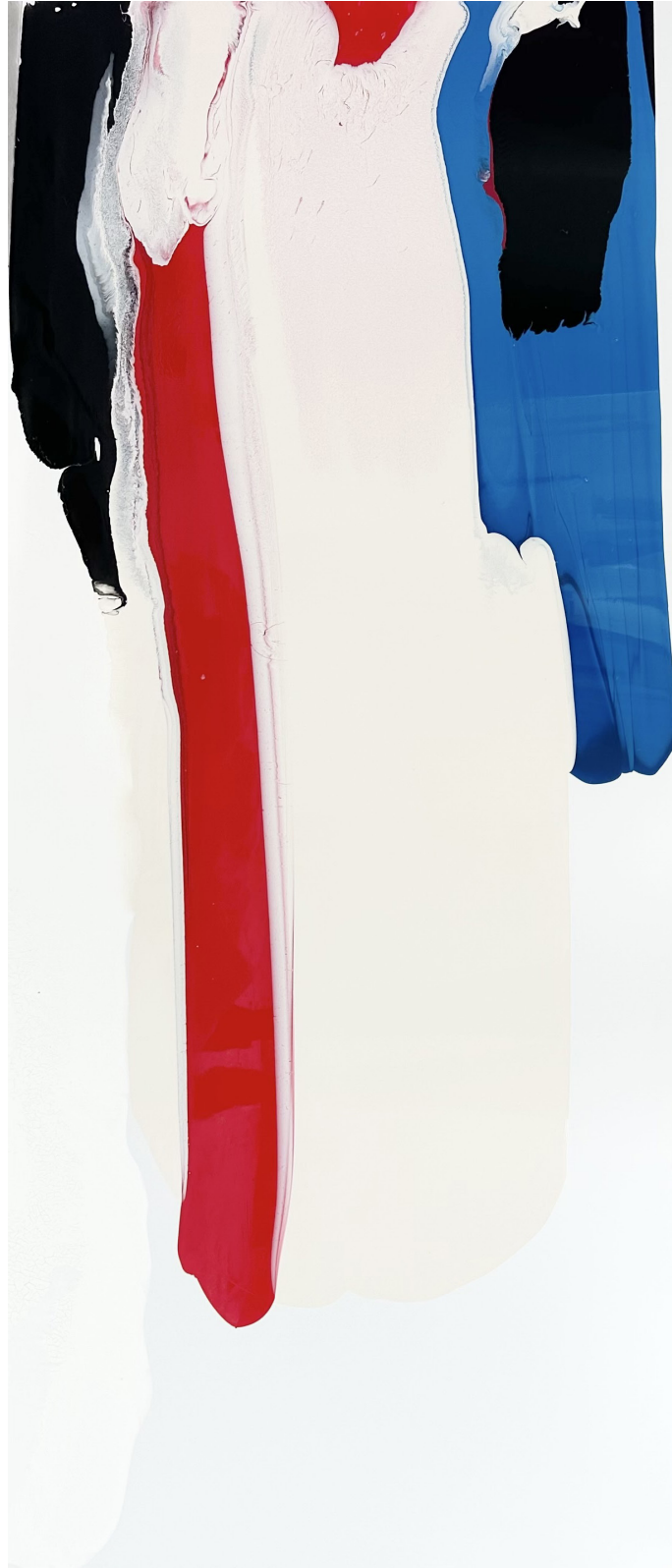
Tauchgang 03 (verfügbar auf Anfrage, aktuelle Leihgabe Fraunhofer Institut Hannover) Acryllack auf Alu-Dibond, 2025 180cm x 80cm 3000€