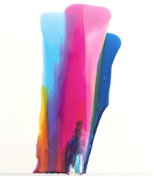
LW 073 Keramiklack und Acrylfarbe auf Synthetikpapier, 2026 40cm x 30cm (inkl. Rahmung 50cm x 40cm mit UV70-Glas) 900€