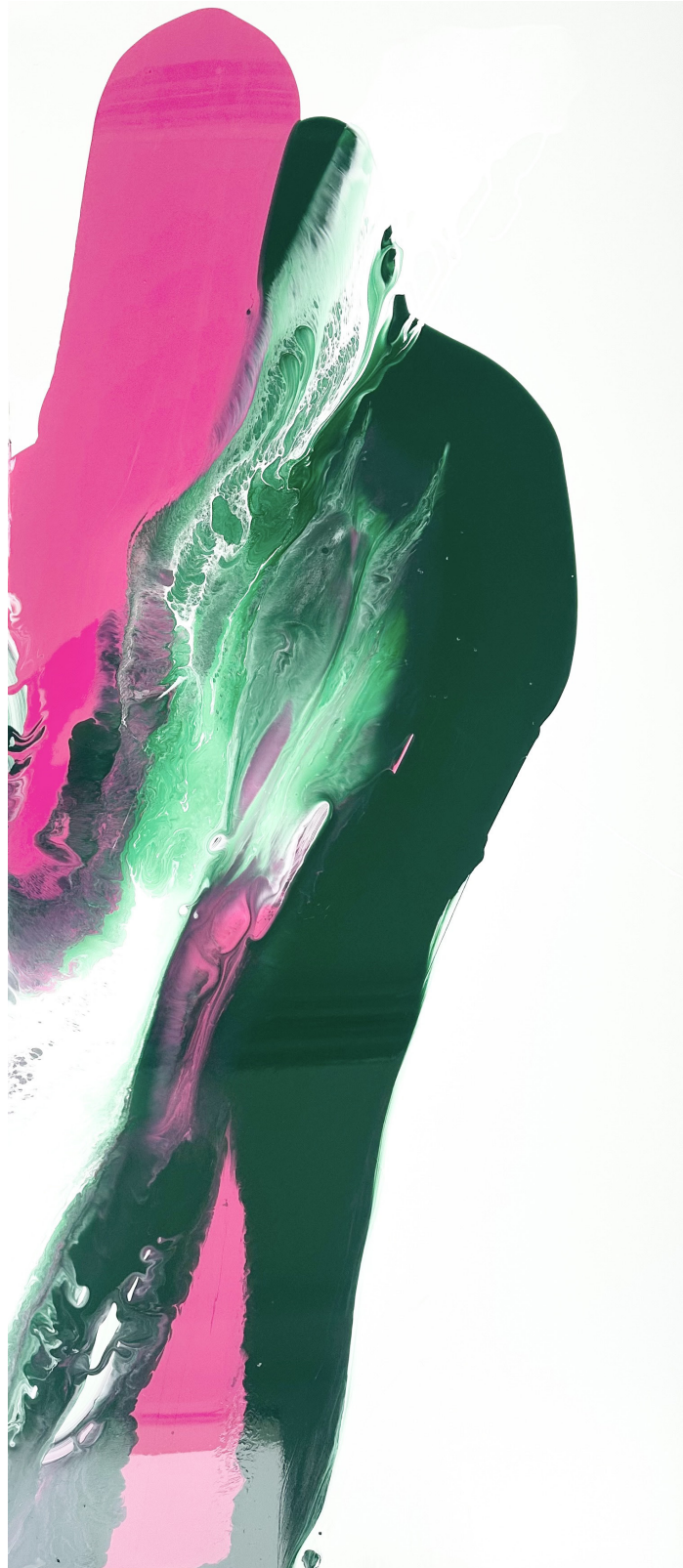
Tauchgang 09 (aus der Serie „2 colours“) Acryllack auf Alu-Dibond, 2025 160cm x 70cm 2600€