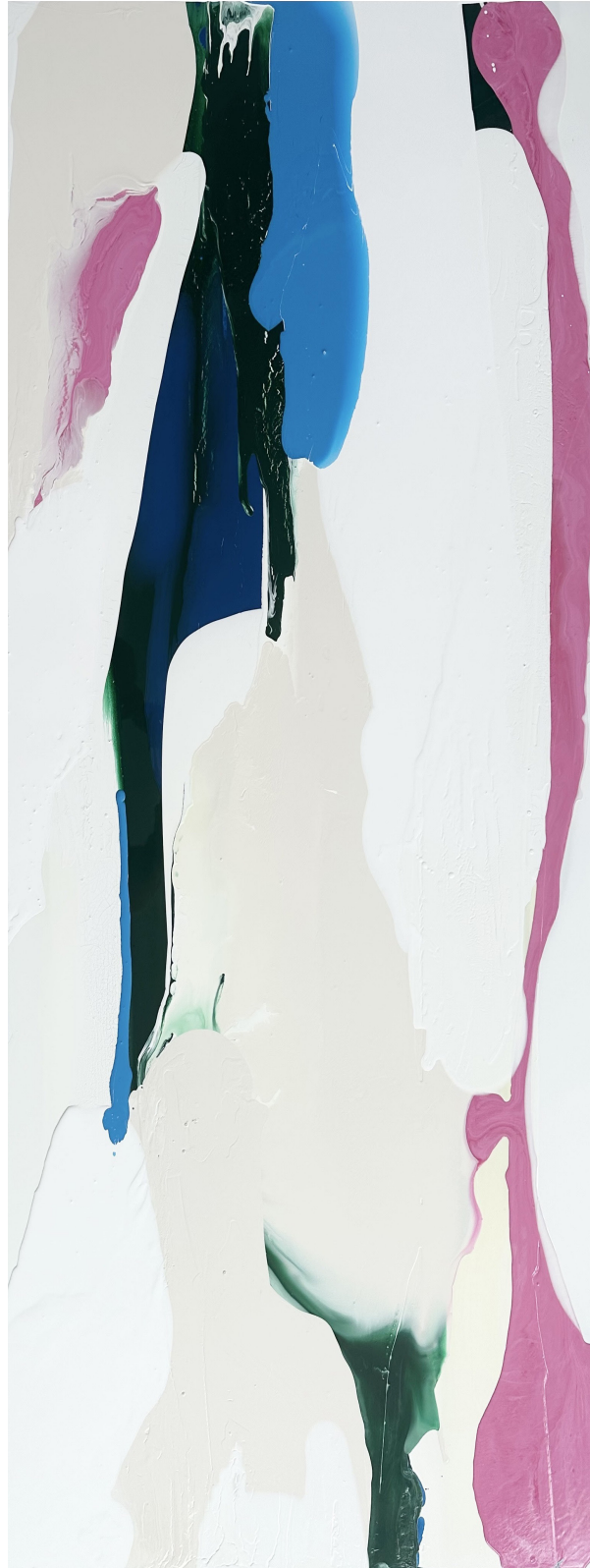
Tauchgang 04 Acryllack auf Alu-Dibond, 2025 160cm x 70cm 2600€