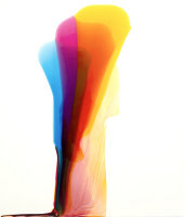
LW 30x20 051 Keramiklack und Acrylfarbe auf Synthetikpapier, 2026 30cm x 20cm (inkl. Rahmung 40cm x 30cm mit UV70-Glas) 650€