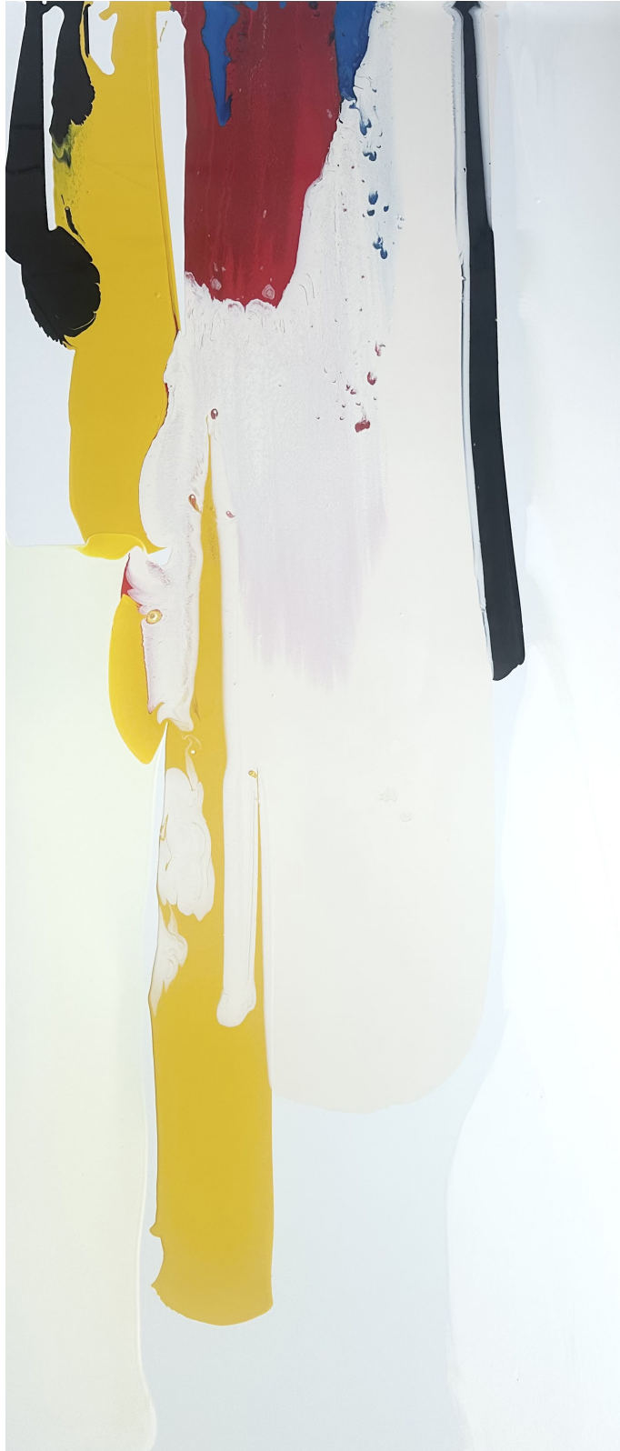
Tauchgang 02 (verfügbar auf Anfrage, aktuelle Leihgabe Fraunhofer Institut Hannover) Acryllack auf Alu-Dibond, 2025 180cm x 80cm 3000€