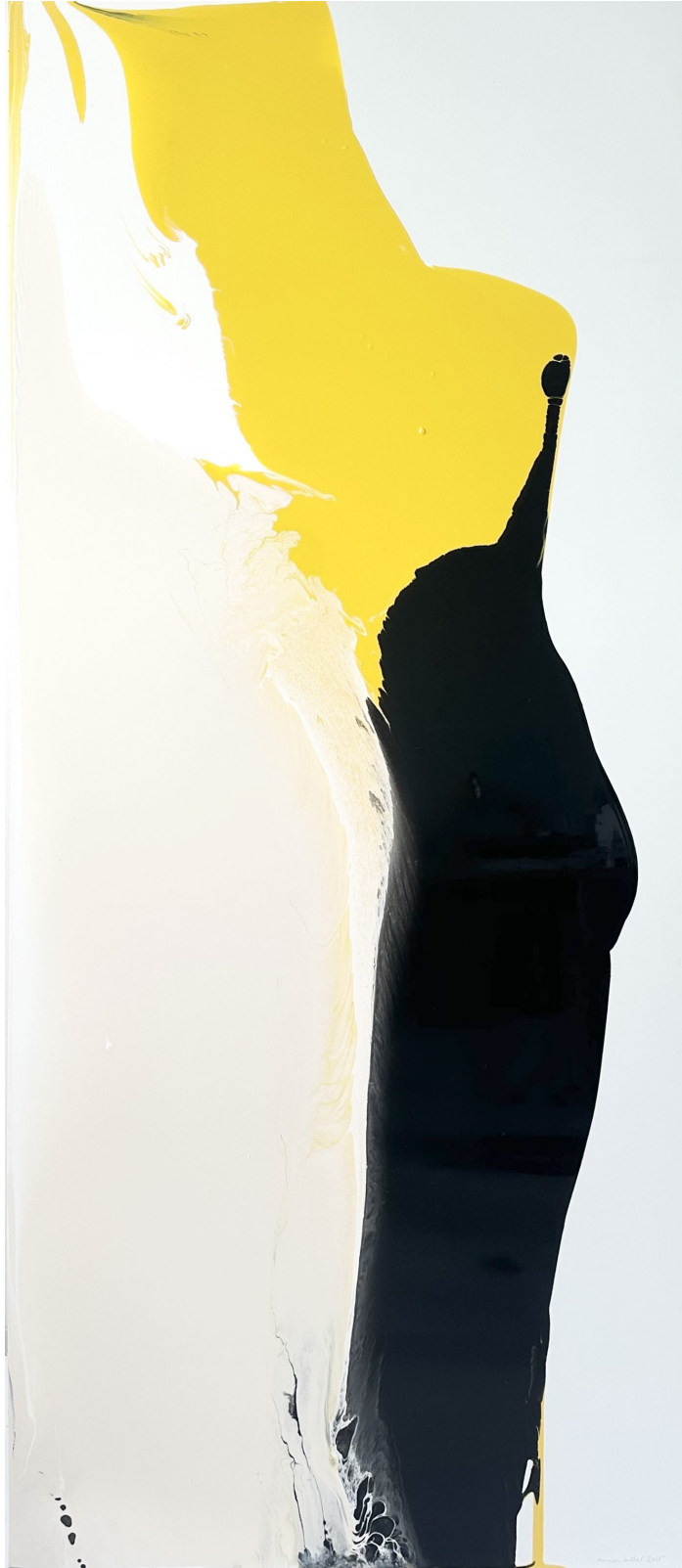
Tauchgang 07 (aus der Serie „2 colours“) - verfügbar ab Ende Juni Acryllack auf Alu-Dibond, 2025 160cm x 70cm 2600€