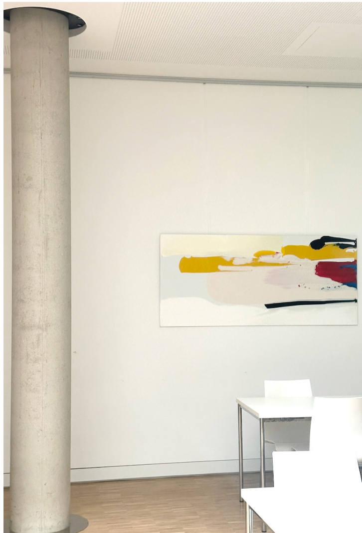
Referenz - Tauchgang 02 im Fraunhofer Institut, Hannover Acryllack auf Alu-Dibond, 2025 80cm x 180cm