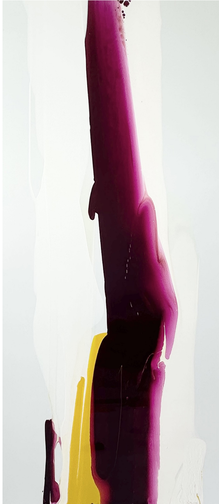
Tauchgang 06 (aus der Serie „2 colours“) Acryllack auf Alu-Dibond, 2025 160cm x 70cm 2600€