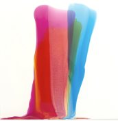
LW 30x20 052 Keramiklack auf Synthetikpapier, 2026 30cm x 20cm (inkl. Rahmung 40cm x 30cm mit UV70-Glas) 650€