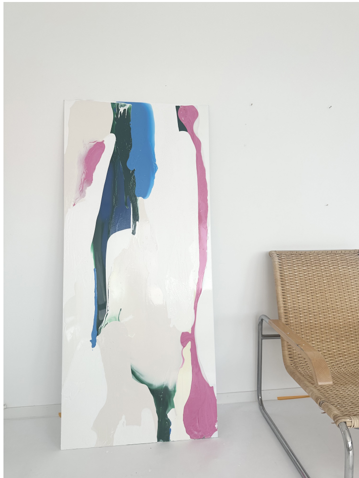
Referenz - Tauchgang 04 im Atelier Acryllack auf Alu-Dibond, 2025 160cm x 70cm