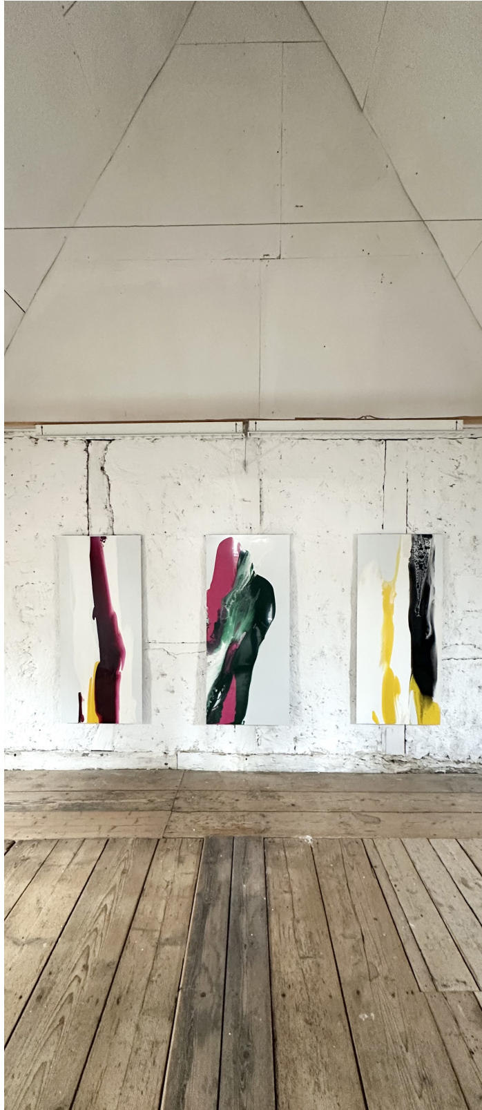
Referenz - Tauchgang 06, 09, 10 („2 colours“ Kunstraum Benther Berg 2026) Acryllack auf Alu-Dibond, 2025 3 x 160cm x 70cm